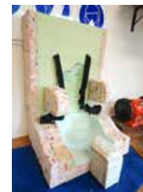
Eine noch nicht ganz fertig gestellte Sitzanpassung.