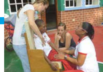
Zusammen mit Everlides bei der Anpassung eines Stuhles für einen Jungen in ALUNA.

Unser Wissen und unsere Erfahrungen beruhen vor allem auf einer korrekten und individuellen angepassten Sitzposition für Kinder mit einer