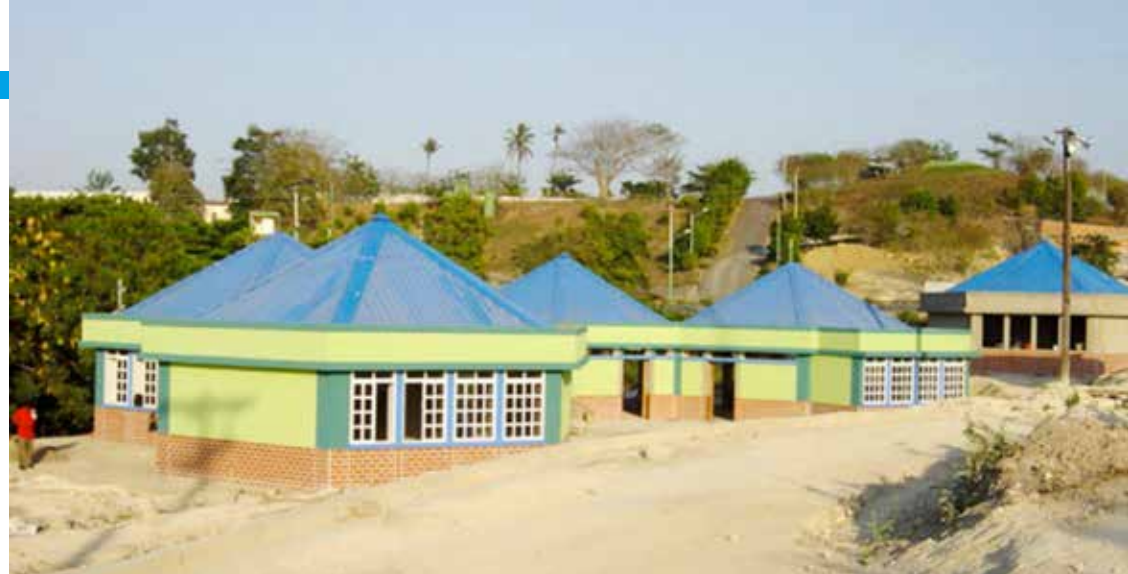
Der Block grün (bloque verde) ist für die Umgebungsarbeiten fertiggestellt. Im Hintergrund sieht man einen zweiten Block mit je 4 Zimmern.

Dass diese Arbeit in den neuen Gebäuden möglich wurde, dafür haben sich in der Schweiz zum Beispiel hunderte von Schulkindern eingesetzt. Unter dem Motto «Wir laufen für ein Lächeln», konnten anlässlich einer Gesundheitswoche der Schulen von Illnau-Effretikon, mit einem Sponsorenlauf für eine Schulküche in ALUNA über 80'000.– CHF gesammelt werden. In Rickenbach fand ein Sponsorenlauf zu Gunsten des Neubaus von ALUNA statt, welcher uns einen Erlös von über 40'000.– CHF eintrug. Die Primarschule Schönengrund organisierte einen Frühlingsmarkt und viele weitere Spenderinnen und Spender sind hinzugekommen. Bis im Sommer 2003 wurde die erste Etappe des Schulhausneubaus für ALUNA mit 12 Schulzimmern, 5 Therapieräumen, einer Grossküche, einer Schülerküche, einem Pausenplatz, sowie einem zweistöckigen Administrationsgebäude abgeschlossen. Die Investitionskosten beliefen sich auf über 968'000.– CHF. Mehr als die Hälfte der finanziellen Mittel wurden in Kolumbien aufgebracht, der übrige Betrag dank der eben beschriebenen Spendenbemühungen aus der Schweiz.